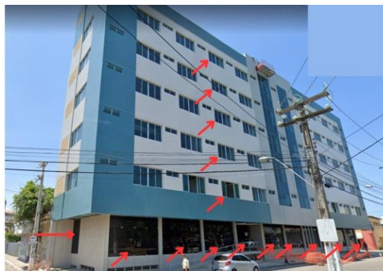
Foto 2: Fachada do edifício com indicação dos locais a serem aplicadas películas.