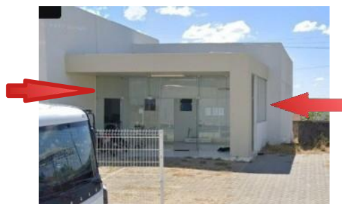
Foto 5: Esquadrias de vidro da 31ª ZE em Major Izidoro