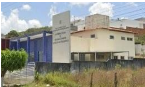
Foto 6: Fachada lateral direita