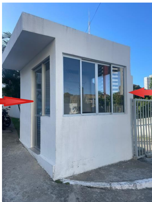
Foto 2: Vista da Guarita com as esquadrias que recebem insolação e receberão Película.