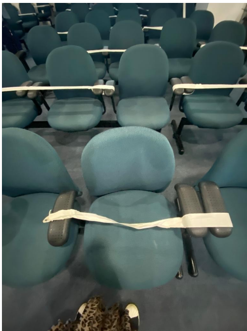
Poltrona a seguir medidas