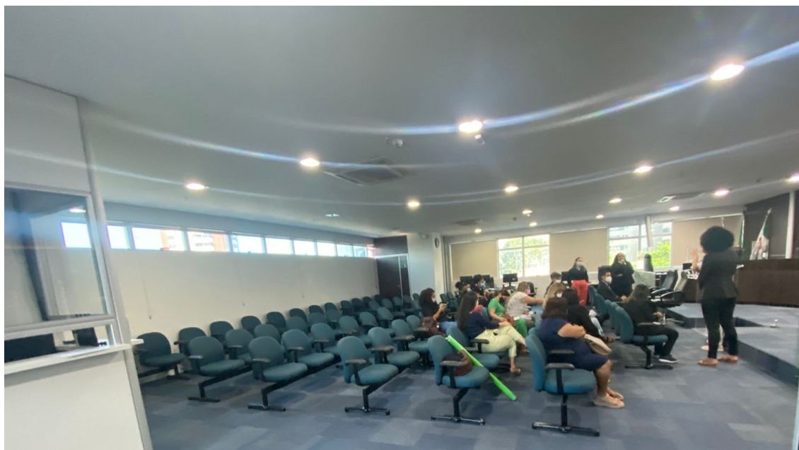
Salão do pleno. Vista das poltronas a serem cobertas no encosto