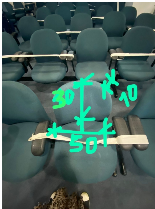
Medidas aferidas como ideal