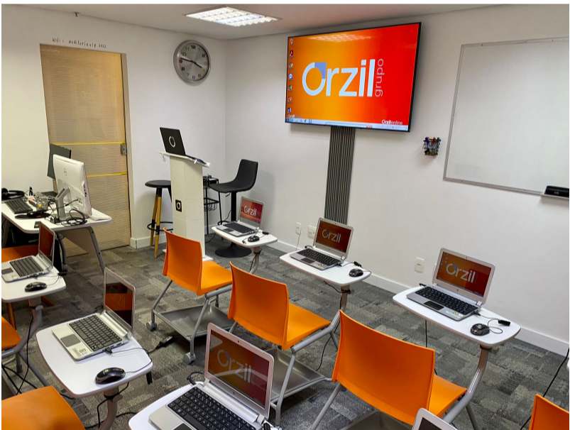
Estúdio 4K – Setor de Rádio e TV Sul - SRTVS, Quadra 701, Bloco O, Sala 618 , Edifício Novo Centro Multiempresarial (Mesmo local do escritório Orzil), Bairro: Asa Sul , Brasília - DF Fotos+