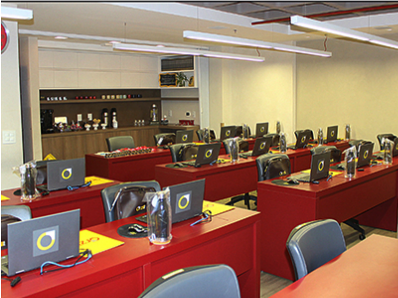
Auditório VIP – Setor de Rádio e TV Sul - SRTVS, Quadra 701, Bloco O, Sala 206 , Edifício Novo Centro Multiempresarial (Mesmo local do escritório Orzil), Bairro: Asa Sul , Brasília - DF Fotos+