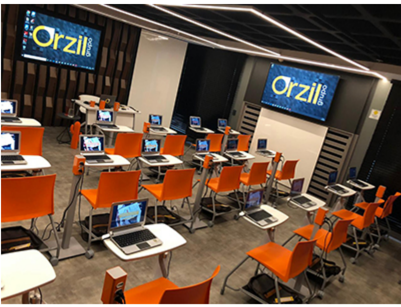
Auditório Executivo – Setor de Rádio e TV Sul - SRTVS, Quadra 701, Bloco O, Salas 336/337 , Edifício Novo Centro Multiempresarial (Mesmo local do escritório Orzil), Bairro: Asa Sul , Brasília - DF Fotos+